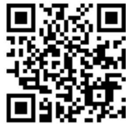
「青年資源讚」資訊網

為提供青年可運用的資源，教育部青年發展署 每半年更新中央各部會及地方政府與青年相關的 計畫或政策，歡迎青年連結運用!!