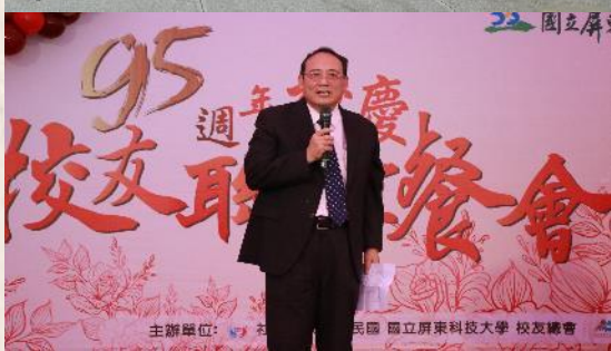
95週年校慶校友聯誼餐會