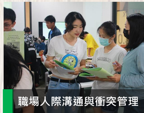
職場人際溝通與衝突管理