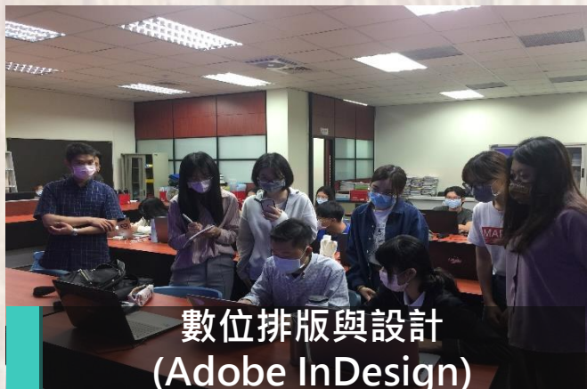
數位排版與設計 (Adobe InDesign)