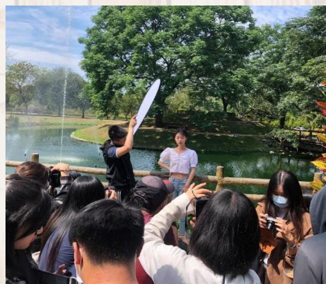
商業攝影與影像後製工作坊