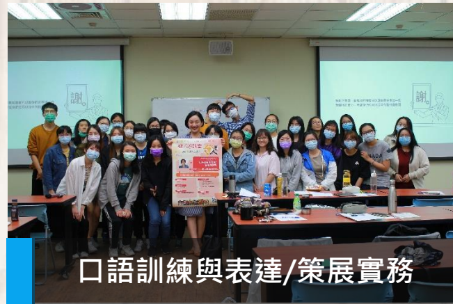
口語訓練與表達/策展實務