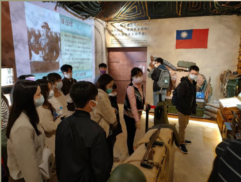
▲桃園忠貞新村戶外參訪

為了想探索我還能走出什麼路，所以我選了一堂教育部職涯輔導的相關課程-高齡學，老師規劃了許多專業課程，更值得一提的是校外參訪的行程更是肯定了我對於採訪寫作的興趣。參訪過程中我看到了原來這個社會除了政治或經濟之類的議題，更多的是被忽略、甚至遺忘的高齡化以及眷村問題，而那些正是我們更應該要去討論的議題，所以我想藉由我微小的力量開始做起，我相信只要有人關注，這個問題就有被改善的可能。