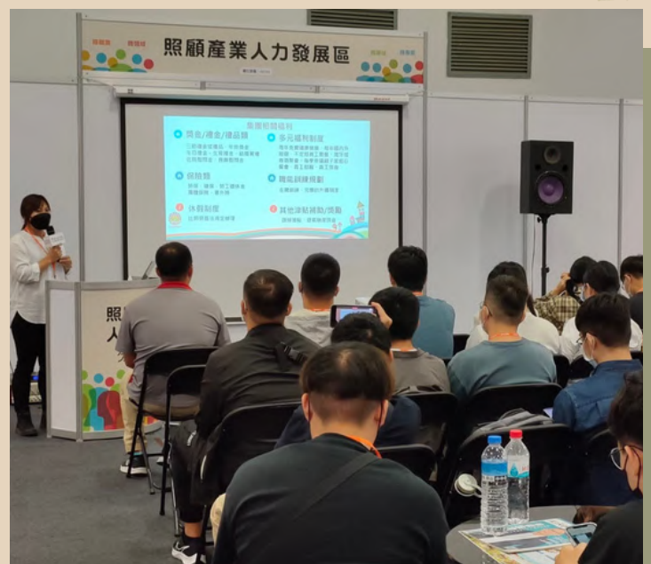
▲台北世貿銀髮科技展戶外參訪

到了現在大三，因緣際會下當上予傳報的副總編，這除了讓我對新聞報導有一份責任感，我也從中看到了更多人對於不同事件的想法及看的角度；藉由予傳報讓我對於未來的規畫更加得清楚，我想未來我還是會朝記者這份工作去做努力並學習，我想把世界正在發生的大小事寫下來讓大家知道，讓人能對於這些事件、這些議題能更加關注。這，就是我想要的未來。