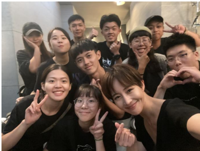
(與代言人張鈞甯合照)