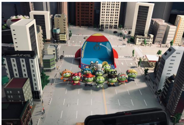
(全家 x 玩具總動員 逐格廣告拍攝)