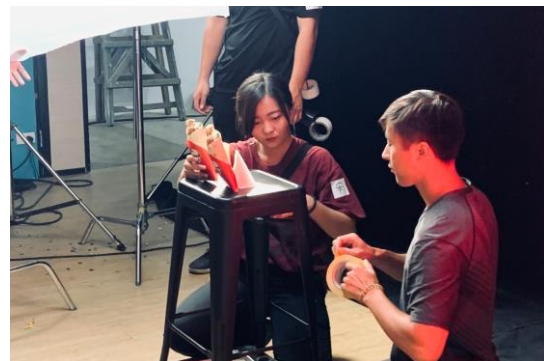
(肯德基蔥油脆雞飯捲廣告拍攝)