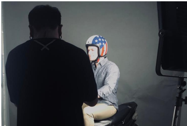
(KYMCO Colombo 廣告試鏡)

在實習一個多月以後，這部片是我遇過最趕但也是我跟到最完整的，從案子進來時的前置會、試鏡、前置準備都有參與到，拍攝當天也幫助執行製片先到第二現場去準備，所以製片組當時只有我一個在，雖然第一次要同時面對技術組、美術組、客戶等等，其實有點緊張，但當下並沒有多餘的時間去多想，只能趕快利用現有的東西去完成指令，好在所有的狀況都有應付住，也受到執行製片的稱讚，是很有成就感的一次經驗。