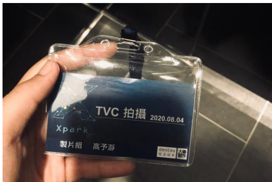
(Xpark 城市水族館廣告拍攝)

我參與了長榮大學大眾傳播學系的【校外媒體實習】也就是獨自一人到台北的廣告製作公司，好能實際學習，也就是一件【孤單但很值得的事】。本來就對自己的大學生涯作了規劃，用大學前兩年的時間學習片場中各職位的工作，除了能更確定自己想要做的職位是甚麼以外，也能真的了解每個職位的艱辛及基本能力，在確立了自己的未來目標是想從事製片組以後，我決定將在學校以及片場學習到的學以致用，直接到業界去了解影視業的運作模式，也是讓自己的能力更精進，並且因為是提早實習，所以即使經過這兩個月的實習以後發現我其實並不是那麼喜歡這職位，我也能比別人有更多的時間再去重新為未來做打算，而這次在大兼製作的兩個月中，我更確立了自己是真的喜歡製片組的。