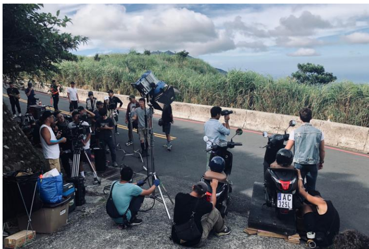
(KYMCO Colombo 廣告拍攝)