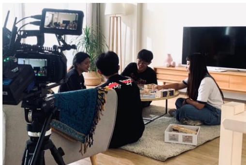
(貓島桌遊廣告拍攝)

而對自己來說，最大的收穫無非是，更確立了自己是真的喜歡製片，也更有滿滿動力往下個目標前進，繼續學習。