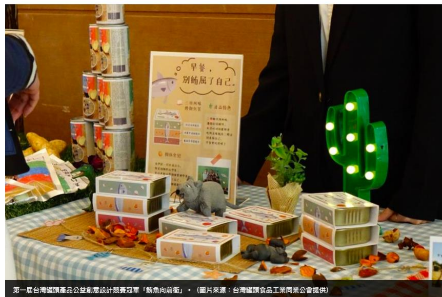
第一屆台灣罐頭產品公益創意設計競賽冠軍「鱈魚向前衝」。