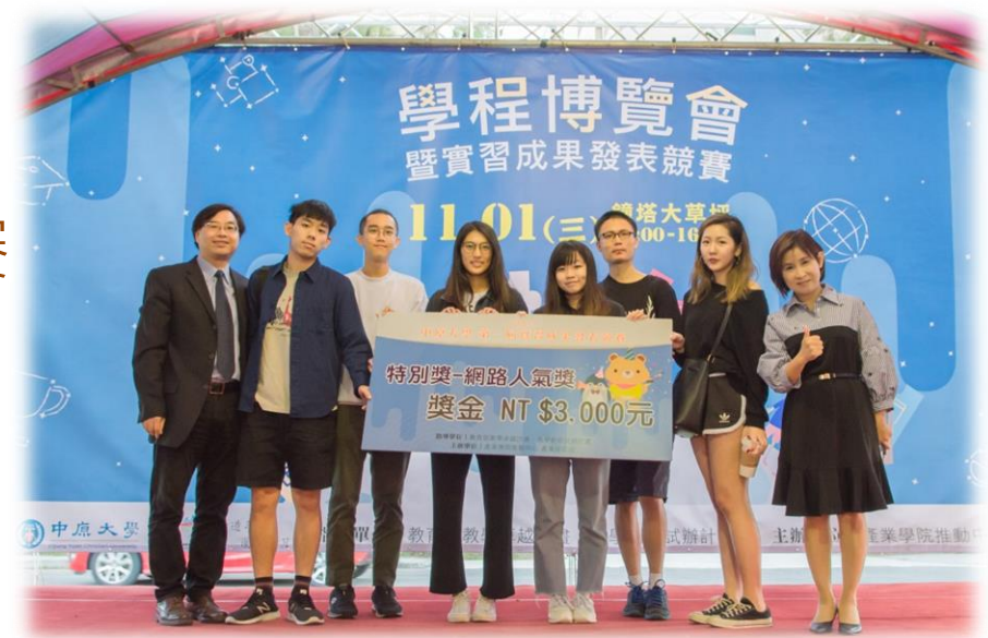
106學年學程博覽會暨實習成果發表競賽