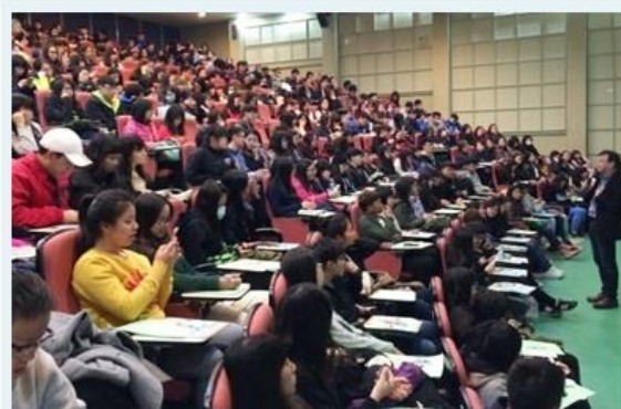
那些電影教我的事 夢想與人生