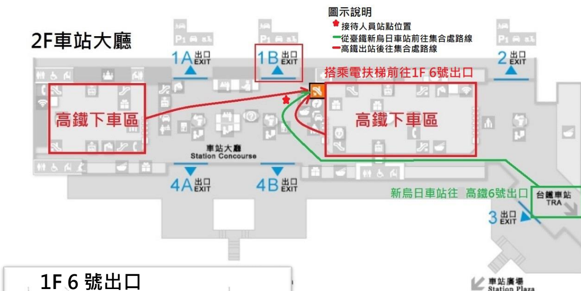
高鐵接駁位置動線規劃示意圖