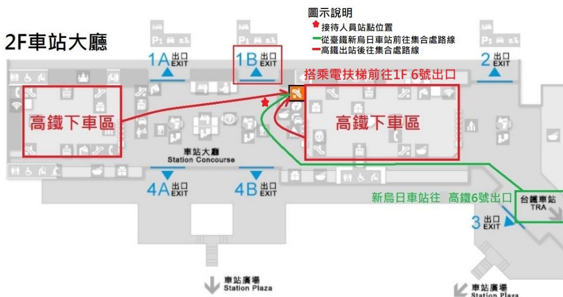
高鐵接駁位置動線規劃示意圖