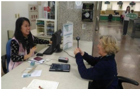
公部門見習，同學於移民署櫃台服務協助外籍人士