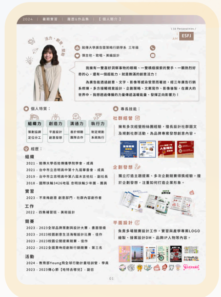
申請實習製作的履歷▲

對於未來職涯方向逐漸清晰，我開始著手撰寫自己的履歷，在整理作品集的過程，也是釐清、梳理對於申請職位的動機，校內課程有二位專業老師協助我們進行履歷健檢、提供求職建議，使我們在履歷添上更多色彩， 發掘自己的職場閃光點 ，進而成功行銷自己！