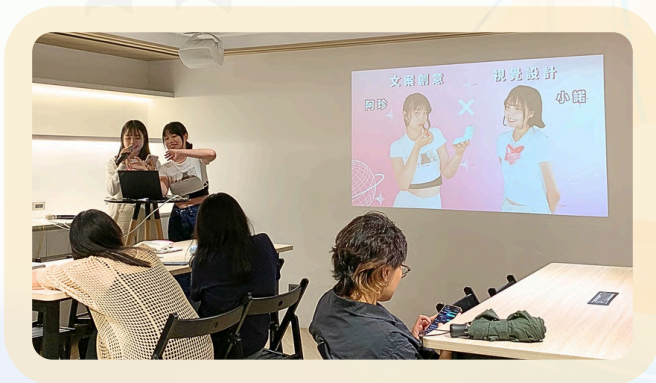
▲向全公司前輩呈現暑期實習執行成果

有了之前參與的職涯課程與活動收穫的知識作為基礎，我對職涯的想像彷彿一艘越駛越趨平穩的船，穿越海上大風大浪，更順利的銜接學業與職場，在大二升大三暑假，成功進入我理想中的職涯—— 廣告公司創意部門 進行實習。