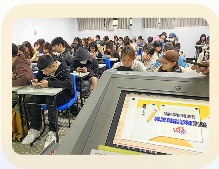
▲帶領同學測驗UCAN情形

我擔任UCAN大專院校就業職能平台領航員，協助班級同學進行職能測評活動，過程中進行職業興趣探索。