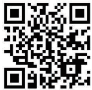
「青年資源讚」資訊網

為提供青年可運用的資源，教育部青年發展署 每半年更新中央各部會及地方政府與青年相關的 計畫或政策，歡迎青年連結運用!!