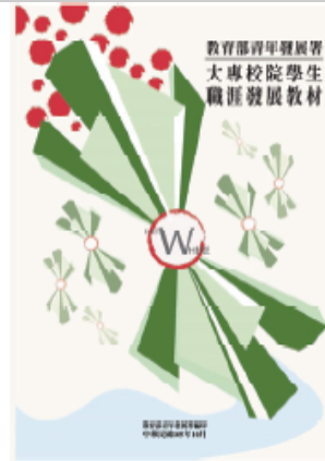
大專校院學生 職涯發展教材 (105年版)