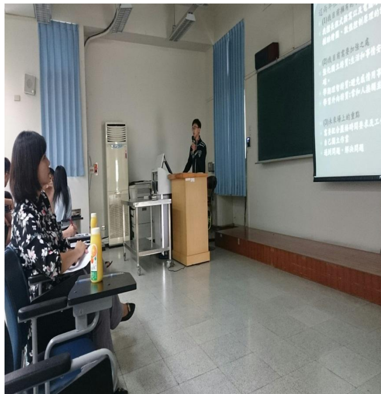
翻轉教學-業師進行學職契合度成果驗收